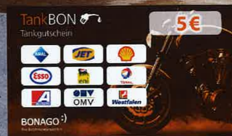
5€ TankBON 1 3 4 4