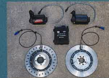
Die BMW-ABS-Komponenten aus dem Jahr 1988

Mit Einführung der Vierventil-Boxer-Baureihe 1993 wurde das ABS II vorgestellt. Die verschiedenen Komponenten des ABS I wurden hier zu einem kompakten Druckmodulator zusammengefasst. Zu den technischen Verbesserungen gehörte auch die Erhöhung der Regelfrequenz. Unter BMW-Fahrern gilt dieses System als das zuverlässigste – vorausgesetzt, es ist regelmäßig im Einsatz. Zwei Fehler tauchen jedoch immer wieder auf: Unterspannung oder zu hohe Stromaufnahme. Ersterer wird durch eine zu schwache Batterie verursacht. Er kann durch das Aus- und Wieder-Einschalten der Zündung gelöscht werden. Dauerhafte Abhilfe schafft aber meist nur eine moderne leistungsstarke Lithium-Ionen-Batterie. Mehr Probleme bereitet der zweite Fehler, bei dem die Steuerkolben nicht mehr freigängig genug sind und eine zu hohe Stromauf-